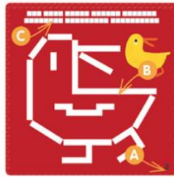
Raven 2 (A) Srednje zahtevne naloge Dejanska velikost (B) Dolžine palic so podane (C)